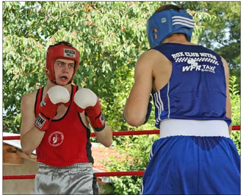
Malačania sa prizerali súbojom jubilejného 15. ročníka medzinárodného turnaja.