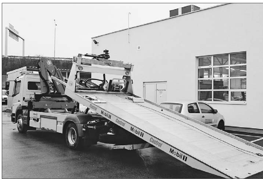
Podobné vozidlo môže odtiahnuť aj vaše auto.