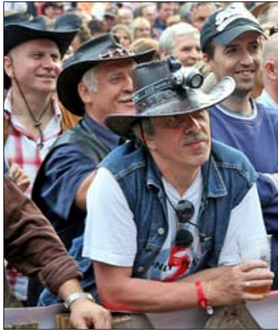
Festival Mlyn je tradične miestom zábavy pre dospelých aj pre tých menších.

Festival je bohatý nielen vďaka menám účinkujúcich (bratia Nedvědovci, Věra Martinová, Peter Nagy, Jana Kirschner, Fragile, Martin Chodúr), ale stavia aj na sprievodných akciách. Chýbať nebude plážový volejbal a na svoje si prídu aj deti v Balulande a v indiánskom tábore. Počas horúčav si nohy môžete ochladiť sčasti v napustenom bazéne. Stanovanie je samozrejme zadarmo. Viac na www.festivalmlyn.sk .