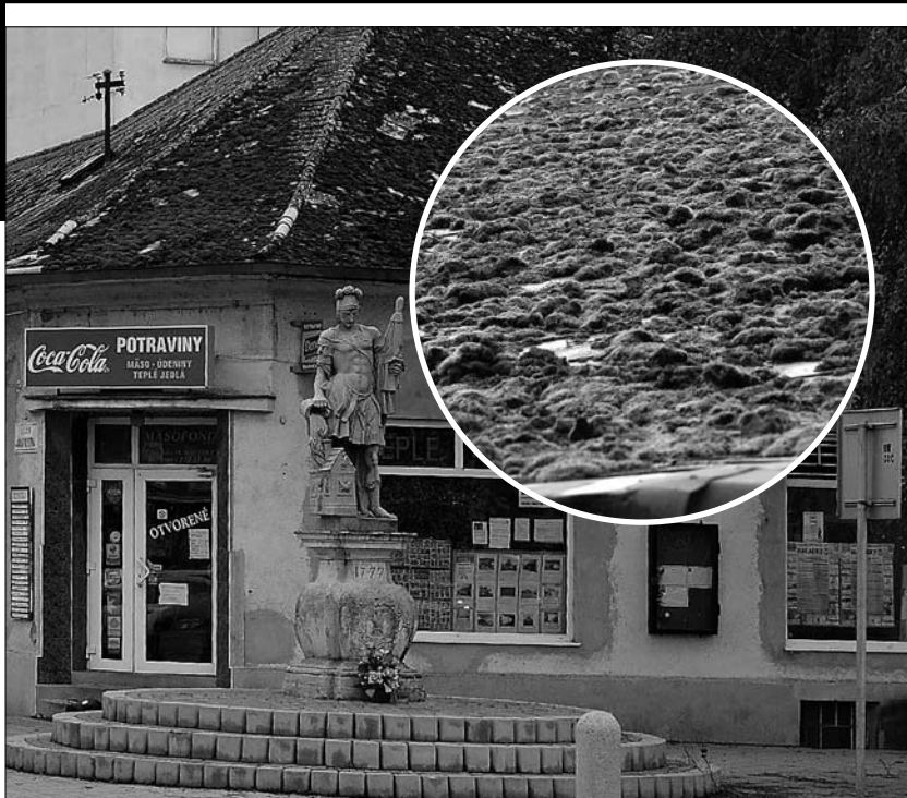
Strecha je v dezolátnom stave, čo potvrdzujú aj tieto zábery z 31. mája tohto roka, kedy sa za výdatných dažďov zazelenala machom.