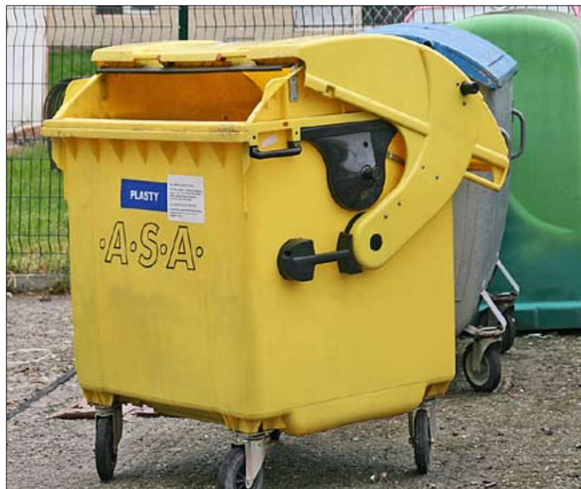
Za preplnené kontajnery na plasty sú často zodpovední najmä tí, ktorí prázdne fľaše či tetrapaky nestláčajú.