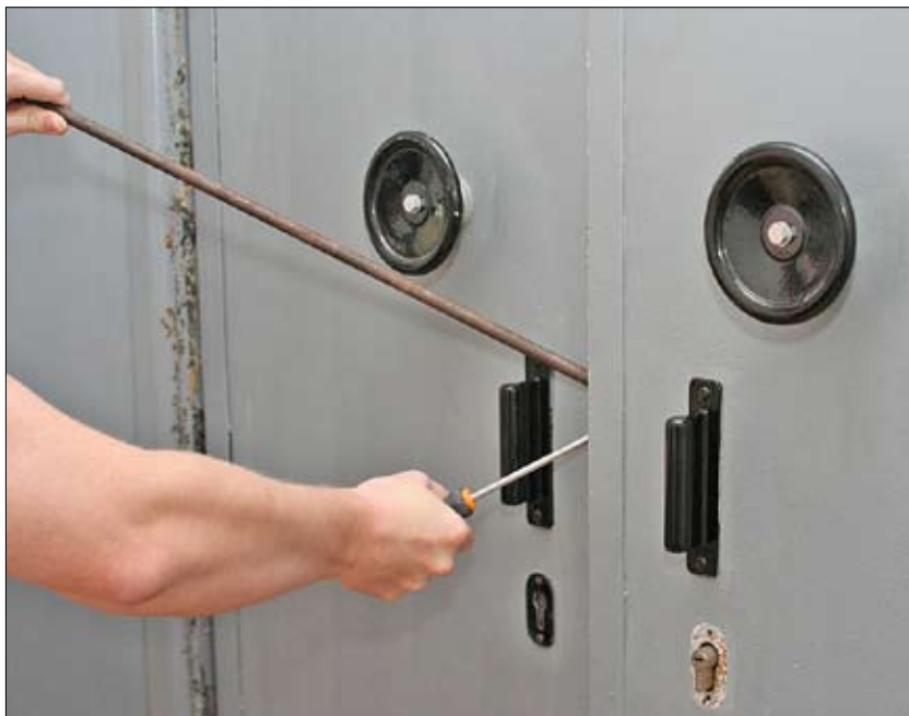
Opustené objekty sú rajom pre zlodějov.