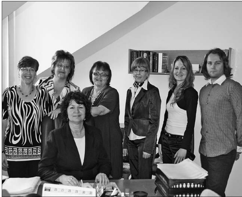
S pracovními odborom živnostenského podnikania pridete do kontaktu, ak sa rozhodnete pracovať na živnosť.