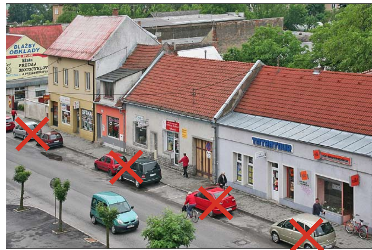
Vozidlá stojace pozdĺž Radlinského ulice budú od 1. júla odtiahnuté.