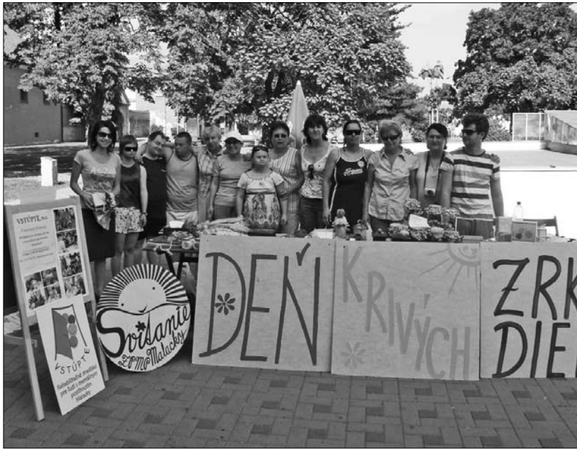
Klienti Domu Svitanie sa delili o priestor s členmi neziskovej organizácie Vstúpte.